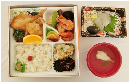
かれい祭りでは、「かれい弁当」が販売されます

また、アサギマダラという渡り蝶の飛来地となっており毎年春と秋は、蝶たちの群舞を見ることができます。5月のかれい祭りに合わせて、約15名で現地探索を行います。