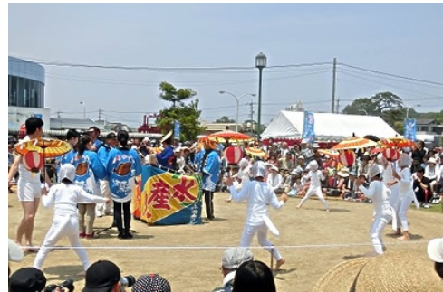
無形文化財の「キツネ踊り」が披露されます